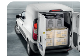
Apertura de hasta 180°