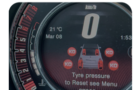
Monitoreo de Presión de Neumáticos (TPMS)